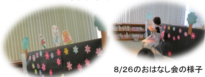
8/26のおはなし会の様子